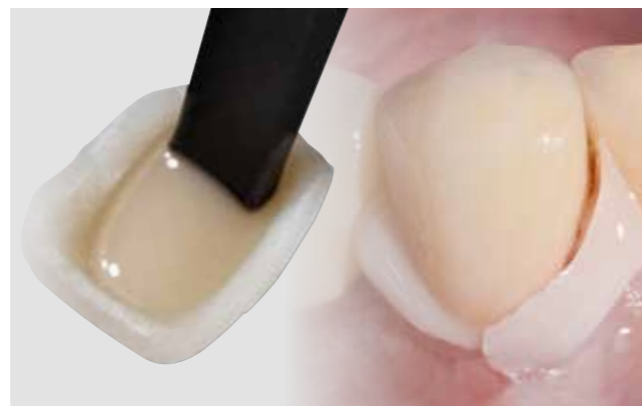
Links: Applikation des Materials mit Veneer Tip. Rechts: Ausgehärteter Überschuss, leicht entfernbar.

Für zusätzliche Sicherheit sorgt die anwenderfreundliche Total-Etch-Technik. Damit lässt sich nach dem Ätzen auf feuchten Flächen arbeiten und somit eine Dentin-Übertrocknung vermeiden.