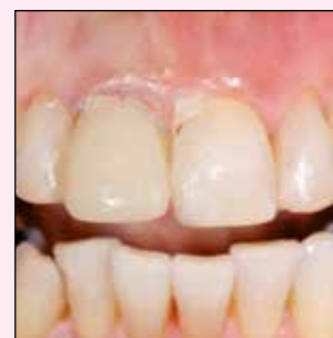
Intraorale Passung der Rohform des Provisoriums