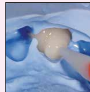
Applikation von Luxatemp Plus in die Vorabformung