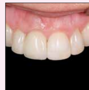
Intraoral nach finaler Lackierung mit Luxatemp Glaze & Bond