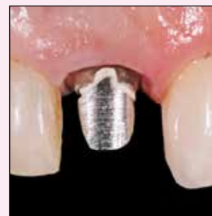
Stumpf mit Sekundärkaries nach Entfernung der Krone