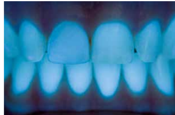
Natürlich fluoreszierende Provisorien mit Luxatemp Fluorescence

Sechs Farbnuancen ermöglichen individuelle, ästhetische Ergebnisse. Die extrem hohe Farbstabilität sorgt für dauerhaft attraktive Langzeitprovisorien. Und natürlich bietet auch Luxatemp Fluorescence die überlegenen Materialeigenschaften und ausgezeichnete Biokompatibilität, die schon Luxatemp Plus zum weltweiten Erfolg machten.