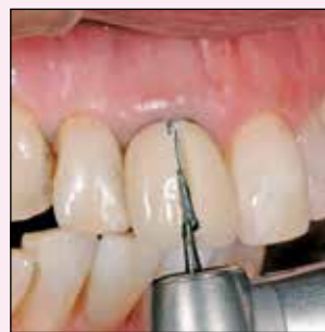
Schlitzung der Krone mit der Hartmetall-Fräse

In der ästhetischen Zahnheilkunde sind temporäre Versorgungen unverzichtbar. Sie schützen nicht nur, sondern ermöglichen auch, ästhetische und funktionelle Anpassungen vor der endgültigen Versorgung vorzunehmen. Mit der Luxatemp-Familie gibt es für jeden Fall eine passende Lösung, um den hohen Ansprüchen an Funktion und Ästhetik gerecht zu werden.