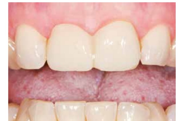
Provisorium gefertigt mit Luxatemp Star