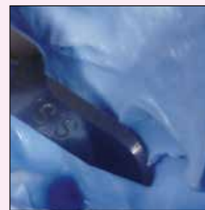
Palatinales Ausschneiden für ausreichende Schichtdicke